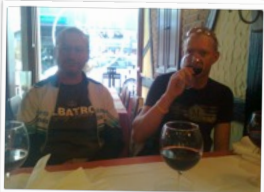
KRIS EN WIJN ;)