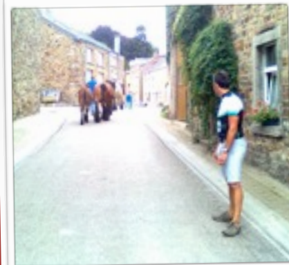
PAARDJES OP DE BAAN